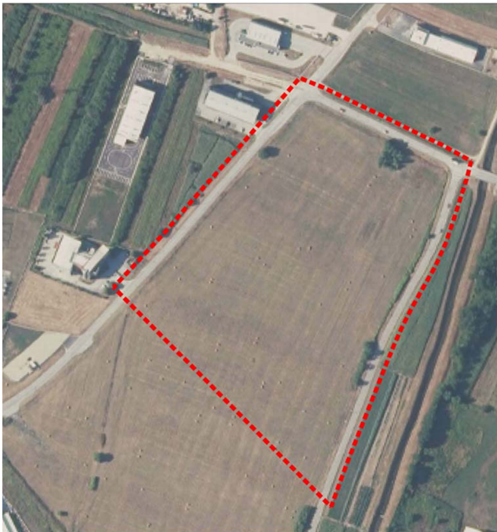
Lokacija područja obuhvata Plana na podlozi DOF 2021-2022. Geoportala